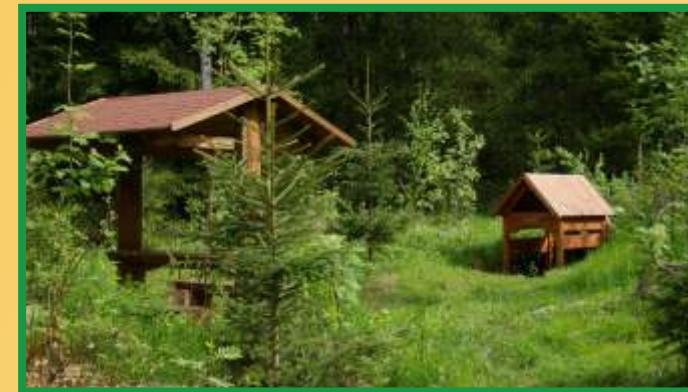
Pít stěšek u Mysí kyselky přímo vybízí k odpočinku.