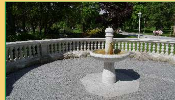
Pítka Balbínova pramene v parku v Mariánských Lázních.